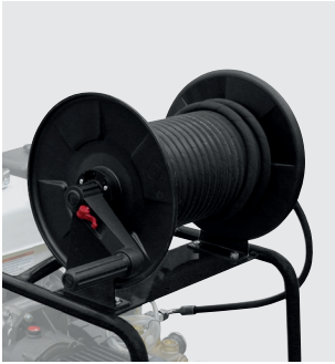
15/20 mt hose reel kit (on request) Kit avvolgitubo con tubo 15/20 mt (su richiesta)