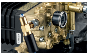
RPM decelerator kit Kit deceleratore di giri motore