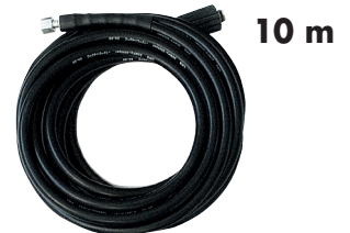
Tubo ad alta pressione 10 m cod. 0.966.0091