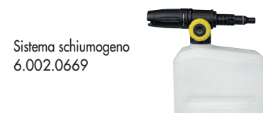
Sistema schiumogeno 6.002.0669