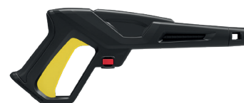
Pistola cod. 6.001.0138