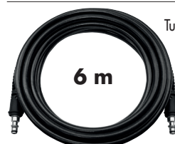
Tubo cod. 4.018.0153