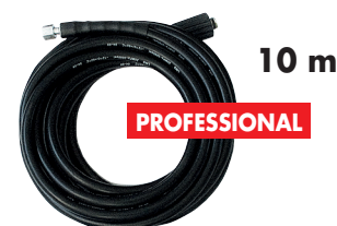
Tubo R2 ad alta pressione 10 m cod. 4.618.0143