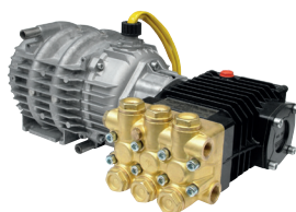
Motore a induzione e testata in ottone