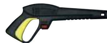
Pistola cod. 00080-02511