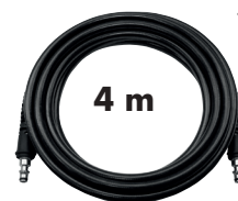
Tubo cod. 00080-02192