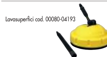
Lavasuperfici cod. 00080-04193