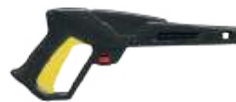
Pistola cod. 00080-02572