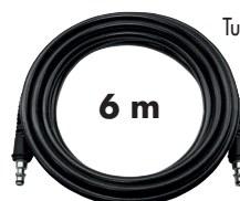
Tubo cod. 00080-02194