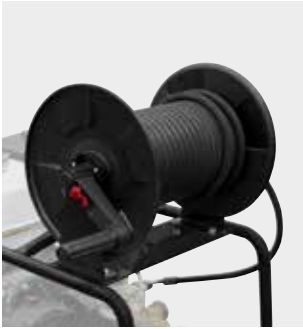
15/20 mt hose reel kit (on request) Kit avvolgitubo con tubo 15/20 mt (su richiesta)