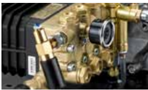
RPM decelerator kit Kit deceleratore di giri motore