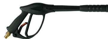
Pistola cod. 3.700.0036